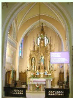
Kościół pw. św. Wojciecha w

Oferujemy dostawę urządzeń, montaż i uruchomienie kompletnego systemu.