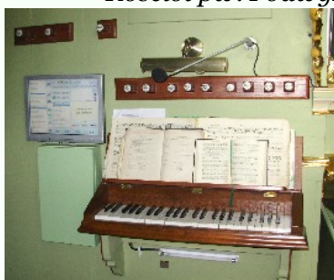
Kościół pw. Podwyższenia Krzyża w Starej